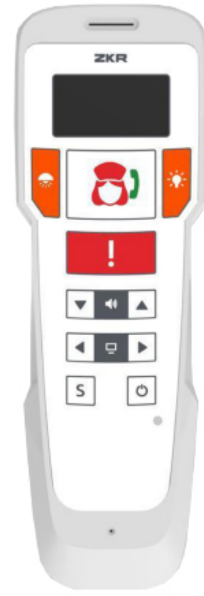
Comfort VoIP Handset