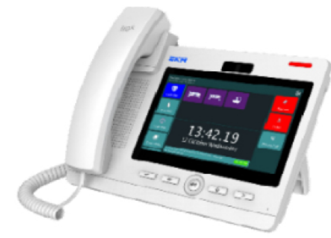
Infinity Nurse Panel