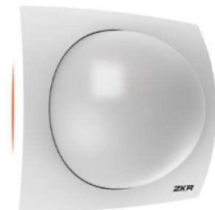
Over Door Light with I/O