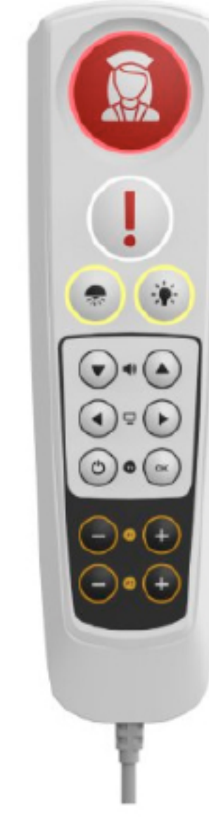
Infinity Pillow Speaker