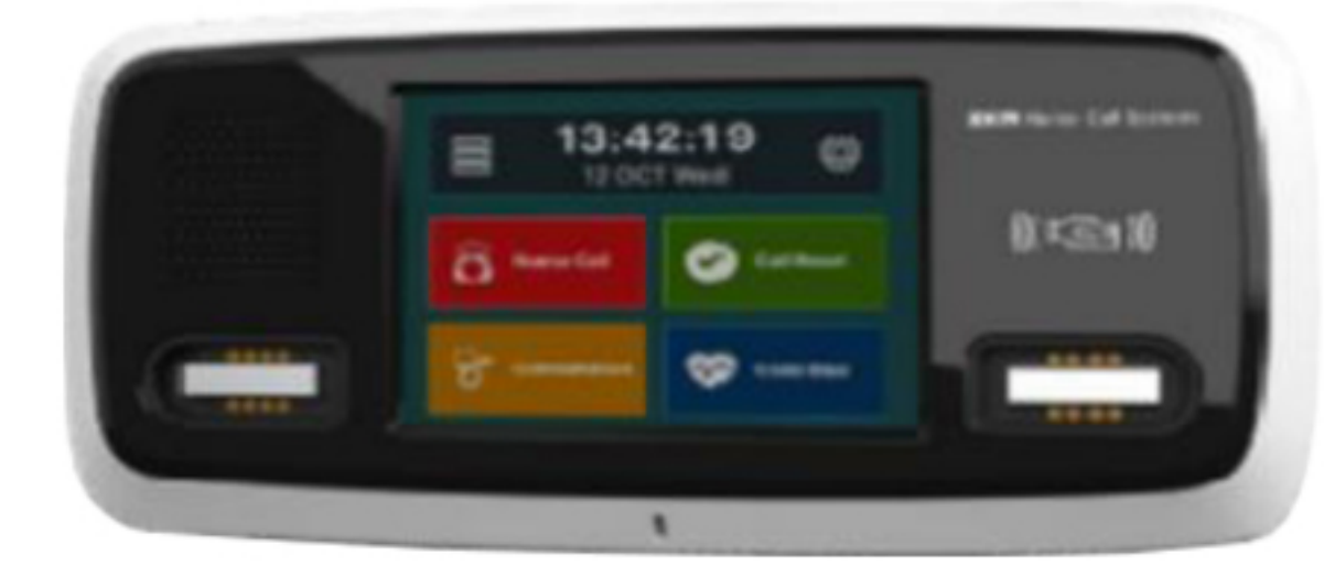
IP Infinity Bedside Console