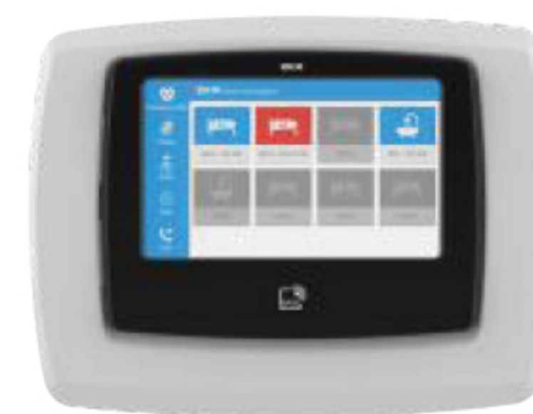
Versatile Plus Room Control Unit 5"