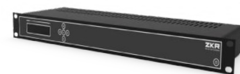
ZKR Application Servers M500