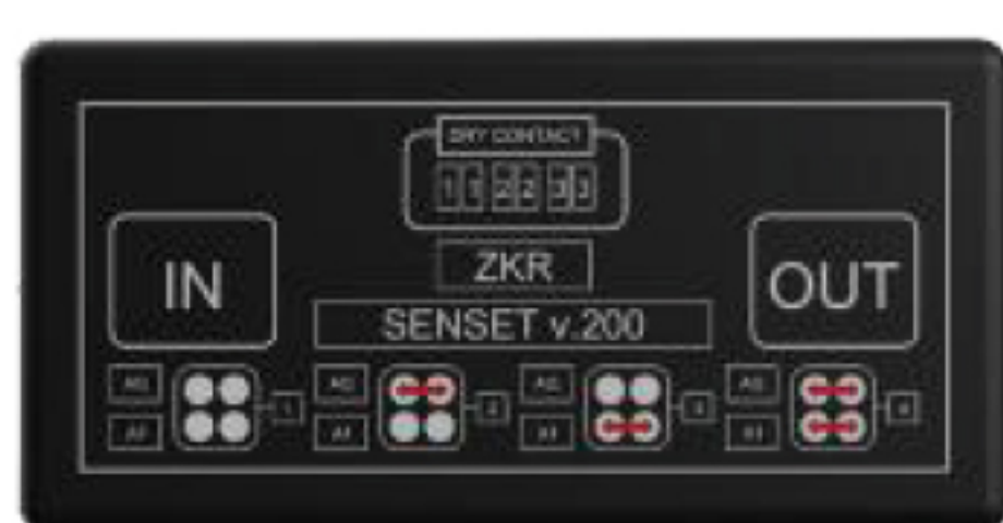
Senset 3 Input Module