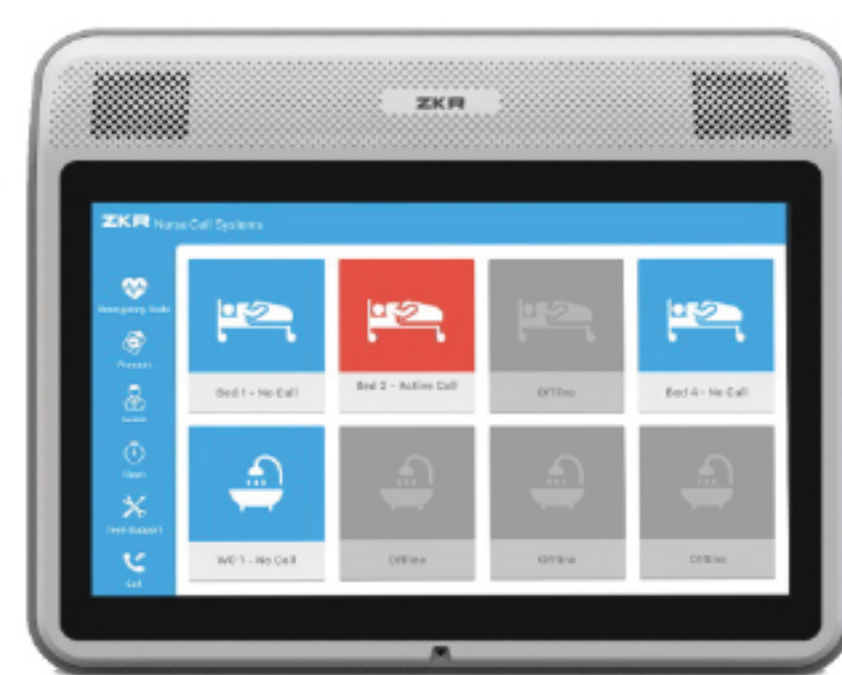
Comfort Room Control Unit 10"