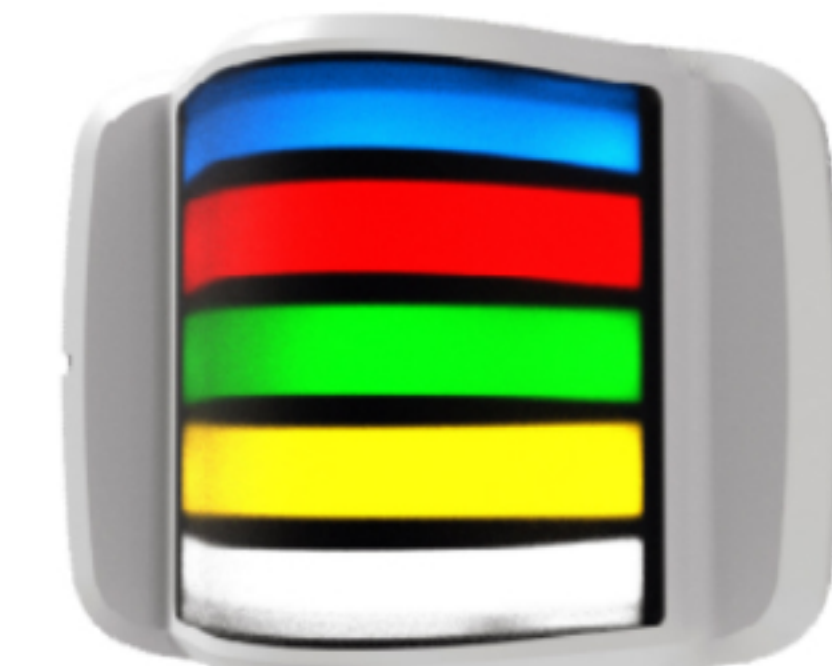
Infinity Indicator Lamp