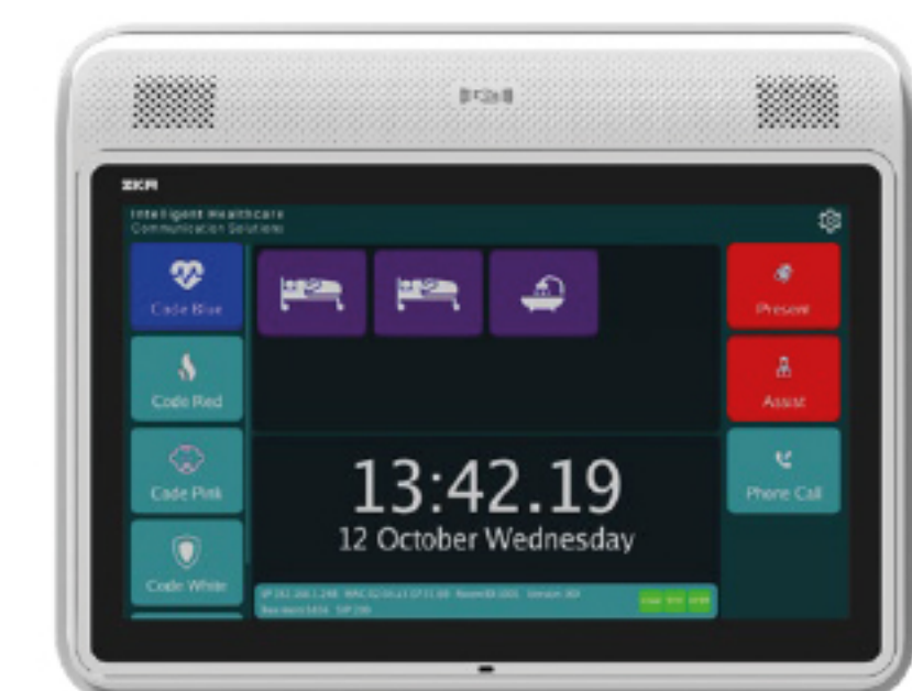
Infinity Room Control Unit