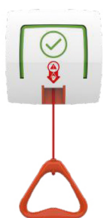
Pull-cord Call Unit