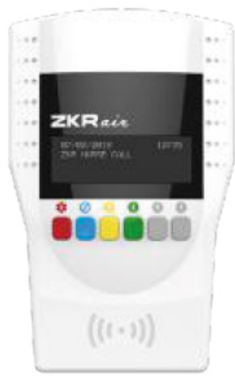
Air Plus Room Control Unit