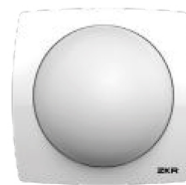
Over Door Light