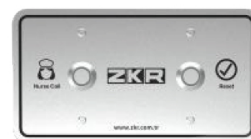
Custodial Cell Call Unit