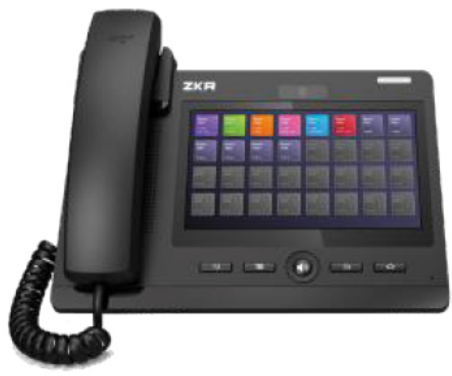
VoIP Nurse Control Panel 7"