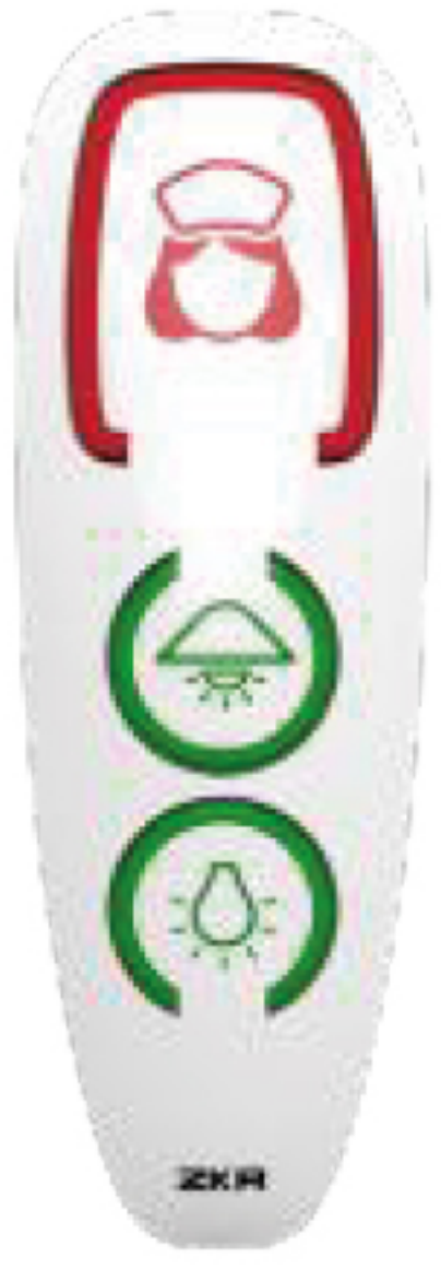
Basic VoIP Handset