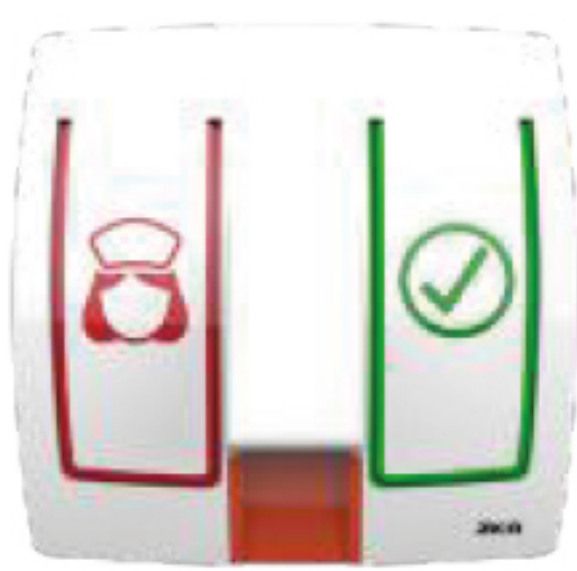
Bedside Call Unit