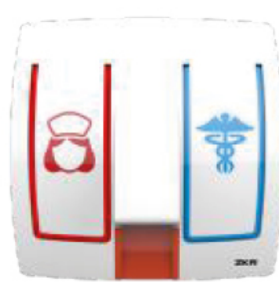
Code Blue Unit