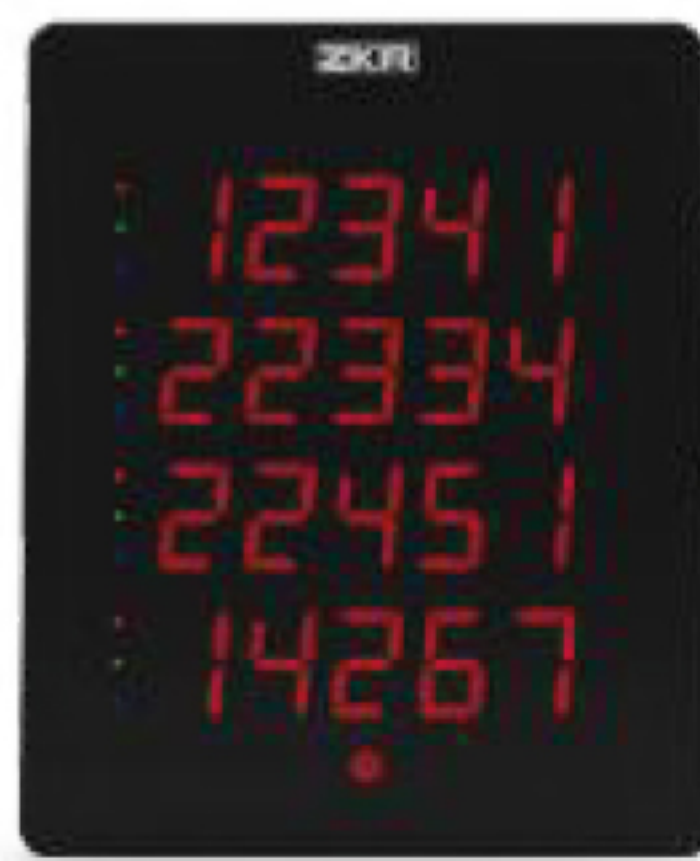
Air Basic Dot Matrix Panel

Peralatan koridor digunakan untuk menampilkan informasi khusus yang diletakkan di area koridor dan area ruangan pasien. Peralatan ini dapat digunakan secara nirkabel dan juga dapat digunakan dengan IP sistem.