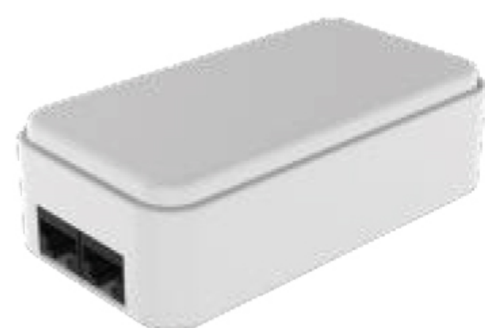
Function Control Module