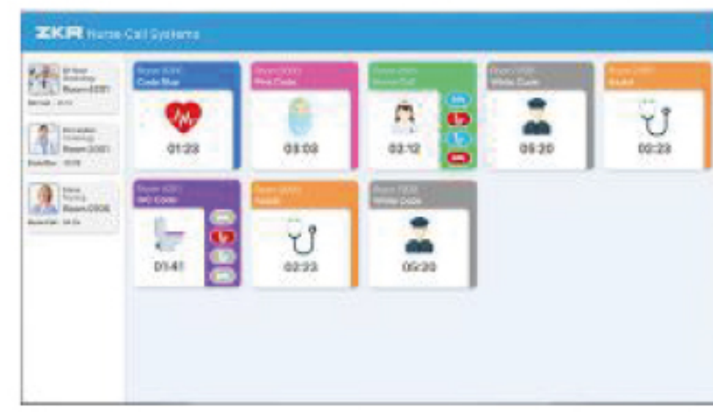
Central Monitoring Software