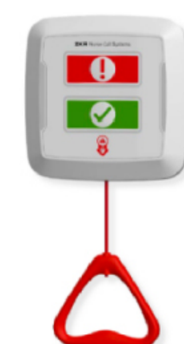
Infinity Pull-cord Call Unit